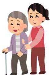
加算なし 機能訓練