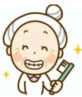
加算なし 口腔ケア