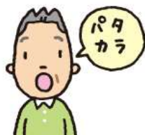
加算なし 口腔体操