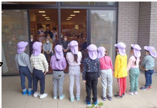
4~5歳の9人が声をそろえて元気に挨拶をしてくれました！