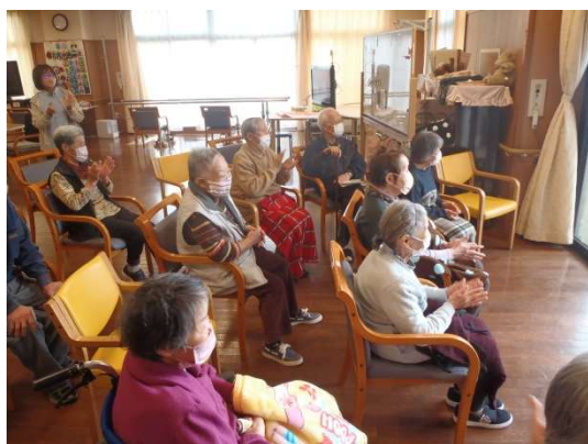
利用者様の何とも言えない笑顔！終始手拍子をされておりました！