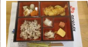
お祝い膳の昼食です