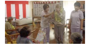
祝い年を代表して挨拶して下さいました