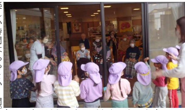
また来てね！待ってるね