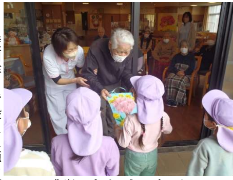
壁画作りで鍛えた腕を活かして感謝の印をプレゼント！