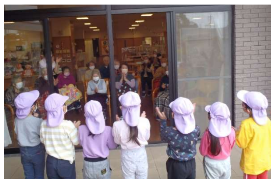
保育園の子供達の歌と利用者様の手拍子のコラボです