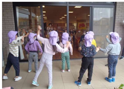
曲に合わせて、一所懸命にお遊戯を見せてくれました！ カワイイ~♪